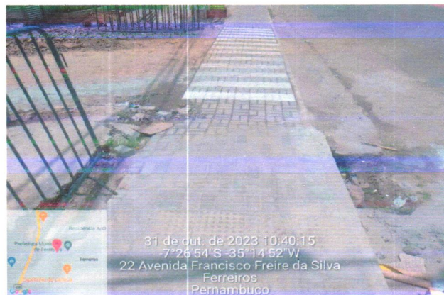
31 de out. de 2023 10:40:15 -7°26'54"S -35°14'52"W 22 Avenida Francisco Freire da Silva Ferreiros Pernambuco

ITALO HENRIQUE CAVALCANTE DE ALMEIDA:07963031429 Assinado de forma digital por ITALO HENRIQUE CAVALCANTE DE ALMEIDA:07963031429 Dados: 2023.10.31 11:47:38 -03'00'