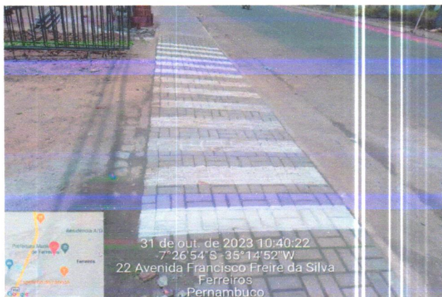
31 de out. de 2023 10:40:22 -7°26'54"S -35°14'52"W 22 Avenida Francisco Freire da Silva Ferreiros Pernambuco