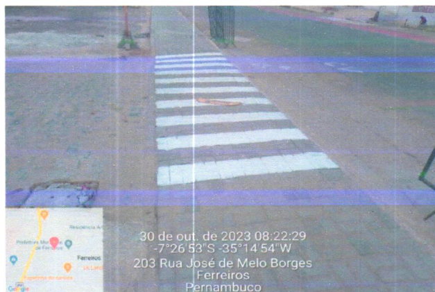
30 de out. de 2023 08:22:29 -7°26'53"S -35°14'54"W 203 Rua José de Melo Borges Ferreiros Pernambuco