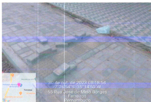
30 de out. de 2023 08:18:54 -7°26'54"S -35°14'50"W 55 Rua José de Melo Borges Ferreiros Pernambuco