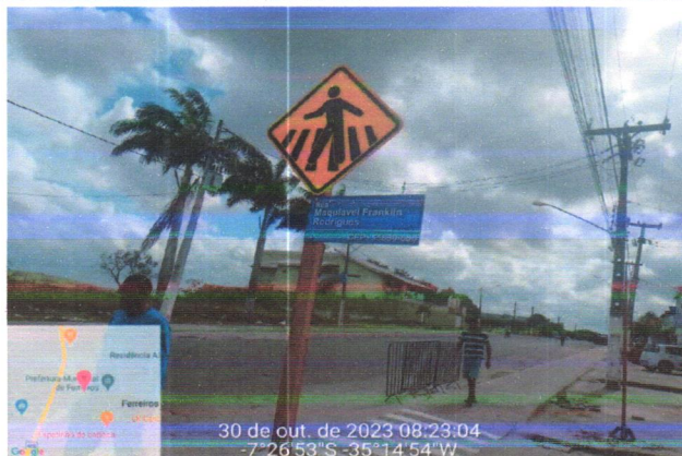
30 de out. de 2023 08:23:04 -7°26'53"S -35°14'54"W