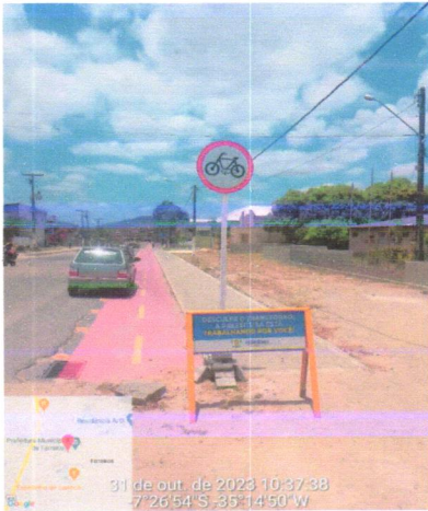
31 de out. de 2023 10:37:38 7° 26' 54" S, -35° 14' 50" W

CONTRATAÇÃO DE EMPRESA DE ENGENHARIA PARA EXECUÇÃO DAS OBRAS DE REQUALIFICAÇÃO URBANA – PORTAL E ACESSIBILIDADE DA ENTRADA PRINCIPAL DA CIDADE DE FERREIROS/PE