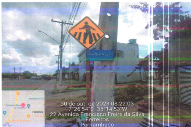
30 de out. de 2023 08:22:03 -7°26'54"S -35°14'53"W 22 Avenida Francisco Freire da Silva Ferreiros Pernambuco