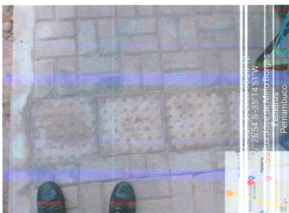
30 de out. de 2023 08:18:54 -7°26'54"S -35°14'51"W Rua José de Melo Borges Ferreiros Pernambuco