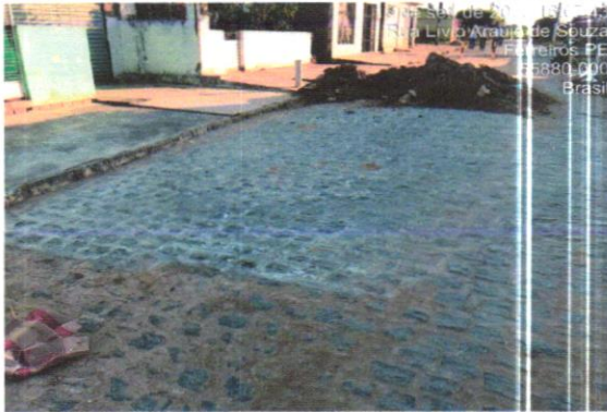
RUA LÍVIO DE ARAÚJO

CONTRATAÇÃO DE EMPRESA DE ENGENHARIA PARA REPOSIÇÃO EM PARALELEPÍPEDOS GRANÍTICOS E MANUTENÇÃO DE VAZ, RUAS E AVENIDAS DE ACORDO COM AS NECESSIDADES DO MUNICÍPIO DE FERREIROS - PE