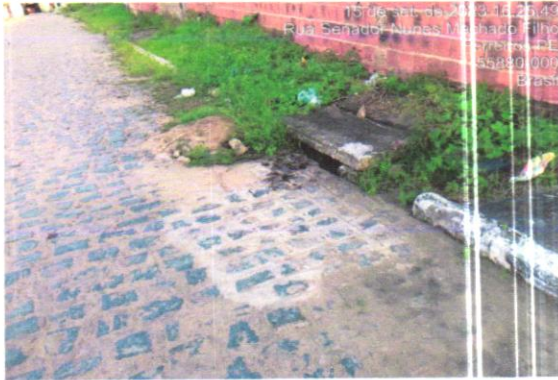
RUA SENEVAL NUNES MACHADO FILHO

CONTRATAÇÃO DE EMPRESA DE ENGENHARIA PARA REPOSIÇÃO EM PARALELEPÍPEDOS GRANÍTICOS E MANUTENÇÃO DE VIS. RUAS E AVENIDAS DE ACORDO COM AS NECESSIDADES DO MUNICÍPIO DE FERREIROS - PE